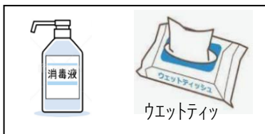
トイレ使用后用品 (表示プレート)