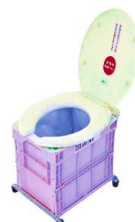
ニードワンタッチトイレ 組立時

3) 使用しないトイレに「使用禁止」プレートかトラテープ貼る (男子小便器は全て使用禁止)